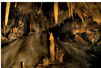
CUEVA DE MENDUKILO