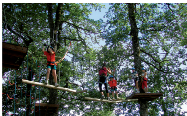
PARQUE DE AVENTURAS