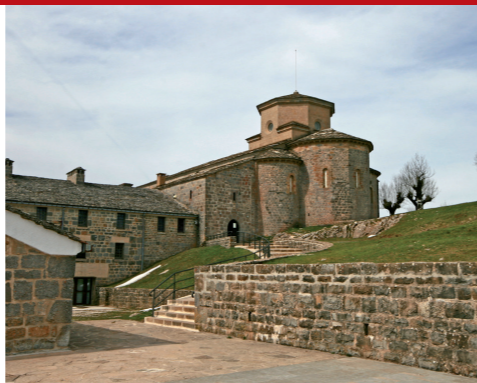
SAN MIGUEL DE ARALAR

Muy próxima a Astitz, en el valle de Larraun, se encuentra la cueva de Mendukilo , acondicionada para realizar visitas turísticas a tres de las salas donde destacan sus hermosas formaciones geológicas.